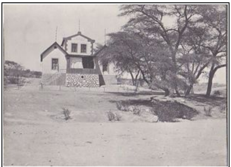
1907 wurde das Offizier-Wohngebäude der Deutschen Schutztruppe am Okawayo Revier gebaut.

Bis zum Ende des Krieges wurde Franke, wie die meisten männlichen Deutschen in Südwestafrika interniert. Er wurde unter Hausarrest auf der Farm und dem Pferdedepot Okawajo bei Karibib untergebracht. Nach seiner Repatriierung 1919 wurde er 1920 durch Reichspräsident Ebert in den Rang eines Generalmajors befördert. Franke litt seit seiner Ankunft in Deutsch-Südwestafrika chronisch unter den Tropenkrankheiten, die ihn zwangen mehrfach umzuziehen. Trotz der medizinischen Hilfe vom Hamburger Tropenkrankenhaus starb er am 7. September 1936 in Hamburg.